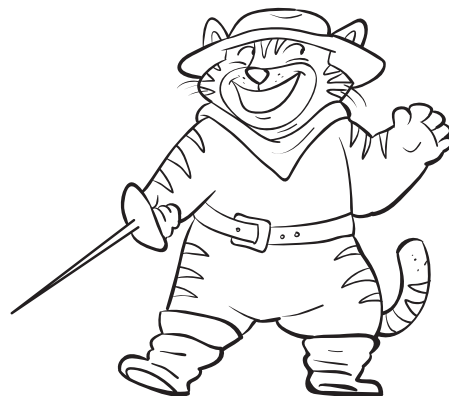
Der gestiefelte Kater